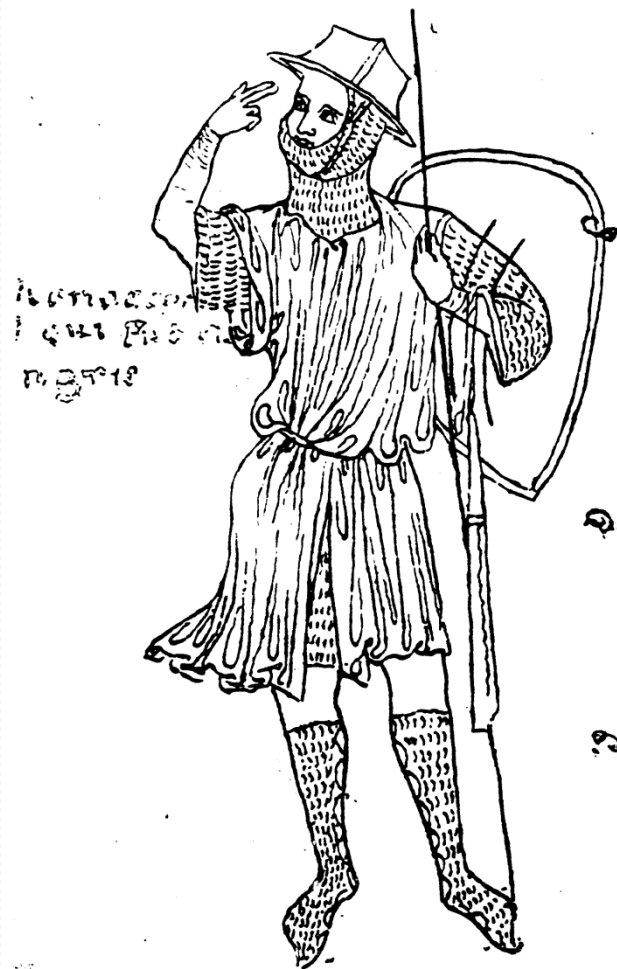
Villard de Honnecourt francia építész hiteles arcképe 13. század Első magyarországi utazása 1230-ban történt. A második útja 1244-47- között történt. Francia elemzések szerint az ócsai templomterv tőle származik.