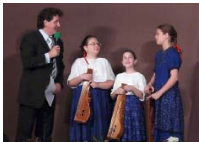
Citeratrió – Pest megye különdíjasai