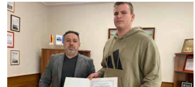
Év vállalkozása Díj Dr. Bata Zrt.