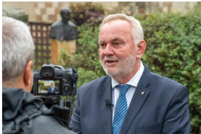
PÁNCZÉL KÁROLY - ORSZÁGGYŰLÉSI KÉPVISELŐ

Ezt követően 2020-ban jött egy olyan, amire aztán abszolút senki nem számított. Egy olyan világjárvány, ami egyszerűen megállította az életet. Rengeteg szenvedést, tragédiát és egy gazdasági válságot is okozott, melyből rendkívül hamar ki tudott jönni az ország, amiért köszönet a munkavállalóknak és a munkaadóknak is! A kormány is megtett mindent, adócsökkentésekkel, támogatásokkal segített.