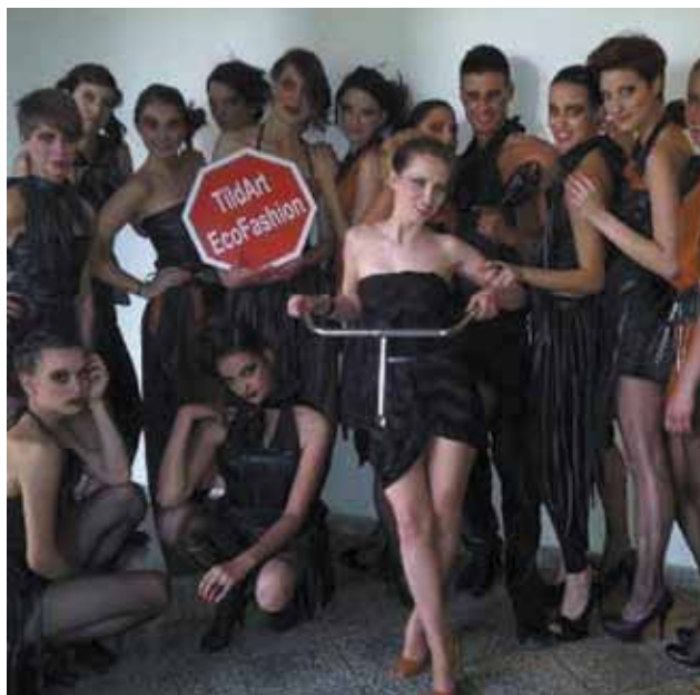
Öko divatbemutató