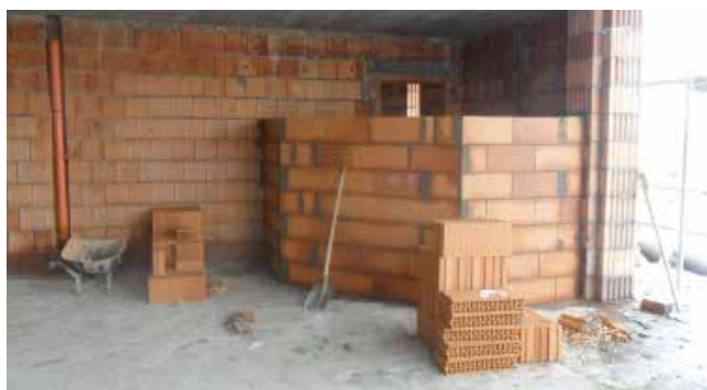
FORRÁS: ÓCSA VÁROS ÖNKORMÁNYZATA

Márciusban a hideg, téli időjárás ellenére is jól haladtak a Manóvár bölcsőde építési munkálatai. Állnak a benti válaszfalak, és kiválasztották már a burkolatokat is. A bölcsődei beiratkozás időpontja: április 15-19. (bővebb információ előző lapszámunkban, illetve a www.ocs.hu oldalon található).