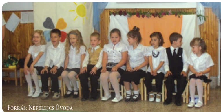
FORRÁS: NEFELEJCS ÓVODA

Óvodánkban már több mint tíz éve az is hagyomány, hogy az év végi hajrá után lezárva a nevelési év szorgalmi időszakát, az óvoda összes aktív és nyugdíjas dolgozói egynapos „buszos” kiránduláson vesznek részt. Felnőtt közösségünk minden tagja nagyon várja ezt a közös „jutalom” napot. Így lesz ez az idei évben is. Július 06-án úti célunk Szarvas – Gyula. A közös kirándulások alkalmával a jó hangulaton, a közösség formálásán túl megismerhetjük országunk épített és természeti értékeit.