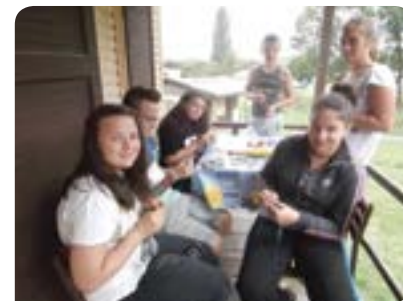
Ócsai táborozók a Margita-Ilona-i sport- és kempingtáborban

Természetesen a pihenés, a kikapcsolódás, a strandolás és a barátkozás volt a főszerep. Sokat labdázunk, tollasozunk, pingpongoztunk, hintáztunk, sakkoztunk, lengőtekéntünk, trambulinoztunk, kosaroztunk, röplabdázunk és kézműveskedtünk ezen a héten. Mindenki nagyon jól érezte magát július 7-e és 12-e között. Vendéglátóink mindent megtettek, hogy feledhetetlen hetet töltsünk a táborban! Az időjárás kedvező volt, mert amikor már „elegünk volt” a strandolásból, napfürdőzésből, mert „leégtünk”, akkor beborult egy rövid időre, de másnap már verőfényes napsütésre ébred-