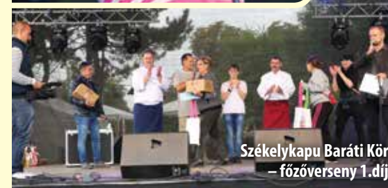
Székelykapu Baráti Kör – főzőverseny 1. díj