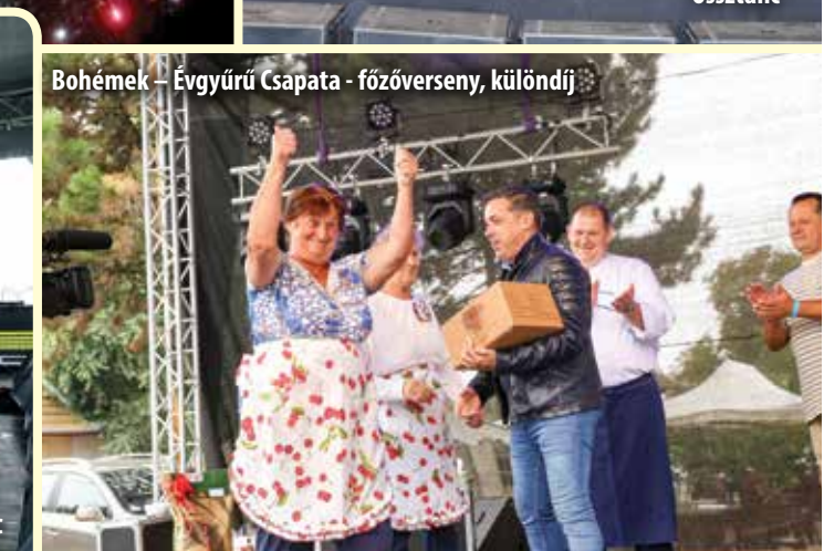
BohémeK – Évgyűri Csapata - főzőverseny, különdíj