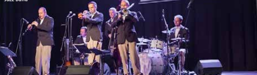
A világhírű Hot Jazz Band