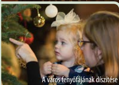
A város fényőfájának díszítése