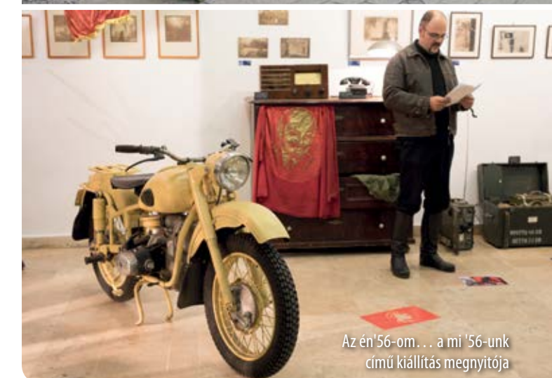
Az én '56-om... a mi '56-unk című kiállítás megnyitója