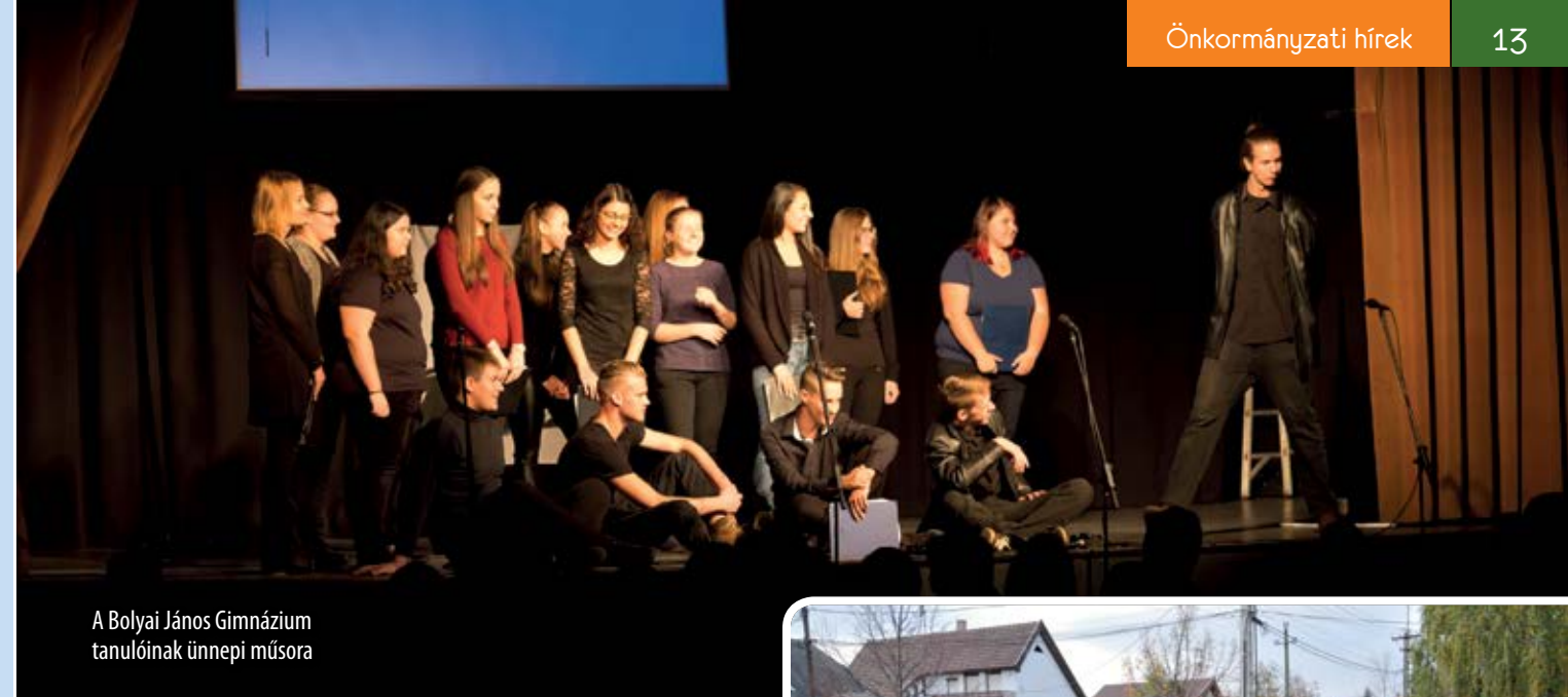
A Bolyai János Gimnázium tanulóinak ünnepi műsora