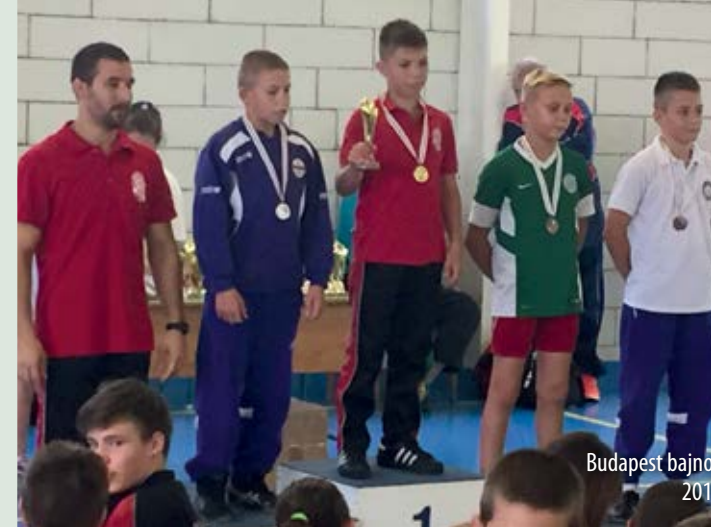
Budapest bajnok 2016

Zsolti említette, hogy Te viszed őt edzésre. Ez napi elfoglaltság neked is, nem kevés teher. Mégis vállalod. Mit