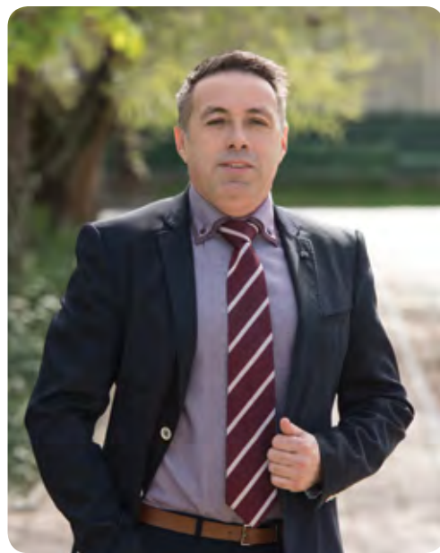
FORRÁS: ÓCSA VÁROS ÖNKORMÁNYZATA

Igen, tervezünk, hiszen egy-két utunkra ráférne a felújítás, ezért is örülök egy pályázati lehetőségnek, ami pont ebben segítene. Önkormányzati feladatellátást szolgáló fejlesztések támogatása címmel jelent meg egy kiírás, melyen belül lehetőség nyílik pályázni a belterületi utak felújítására. Mivel a Vadvirág utcára igencsak ráfér a felújítás és a kész terveink is megvannak, ezért pozitív elbírálás esetén sor kerülhetne erre az útszakaszra is. A pályázatok elbírálása augusztus 5-én várható.