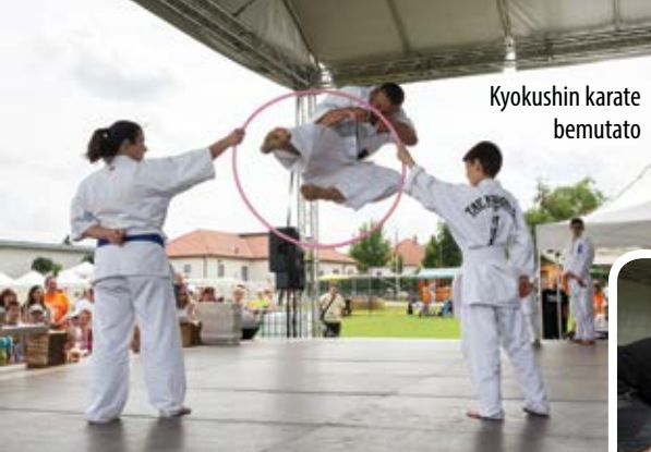
Kyokushin karate bemutató