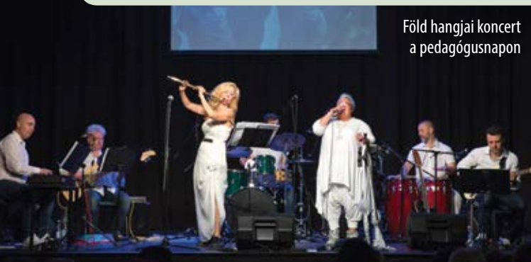
Föld hangjai koncert a pedagógusnapon