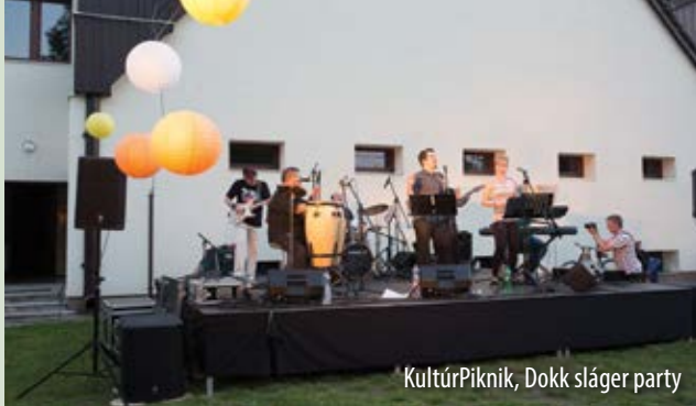
KultúrPiknik, Dokk sláger party