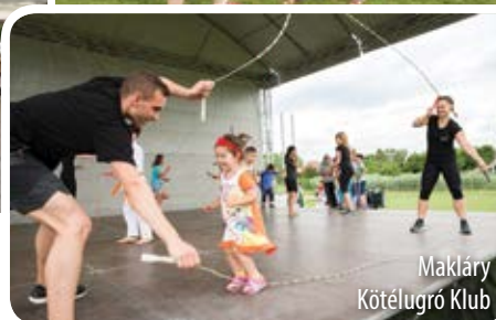
Maklár Kötélugró Klub