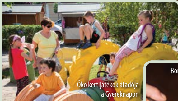
Öko kertjátékok átadója a Gyereknapon