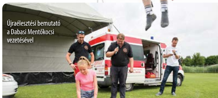
Újraélesztési bemutató a Dabasi Mentőkocsi vezetésével