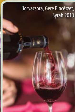
Borvacsora, Gere Pincészet, Syrah 2013