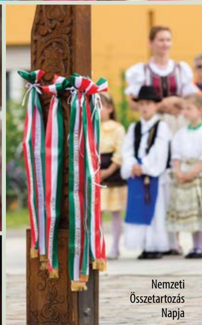
Nemzeti Összetartozás Napja