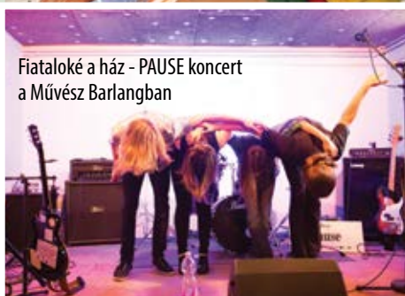
Fiataloké a ház - PAUSE koncert a Művész Barlangban