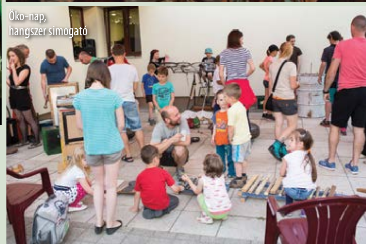
Óko-nap, hangszer simogató