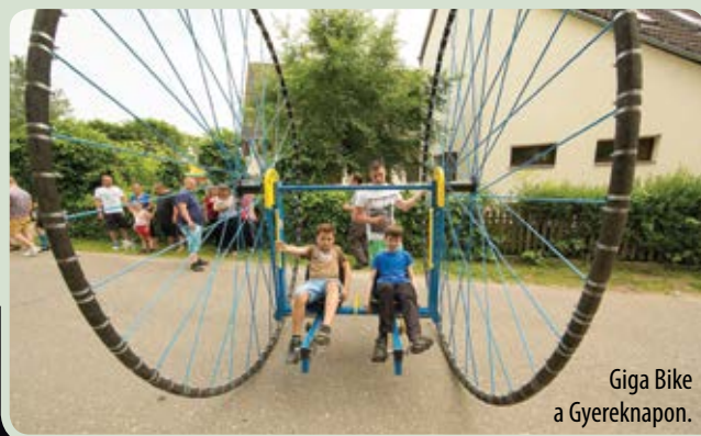
Giga Bike a Gyereknapon.

Köszönöm minden közreműködő munkáját és köszönet valamennyi szponzorunknak a támogatásért, nélkülük nem tudtuk volna ilyen színes programokkal megtölteni a 40. Ócsai Kulturális Napok-at. ☺