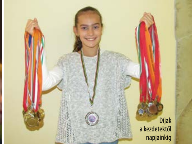
Díjak a kezdetektől napjainkig