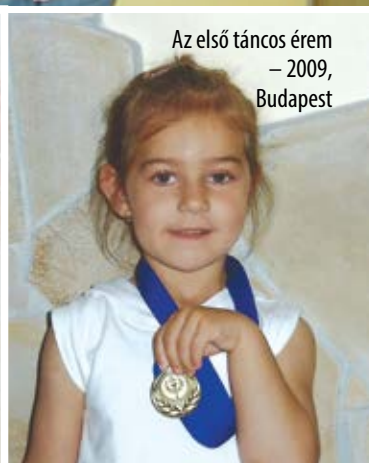
Az első táncos érem – 2009, Budapest