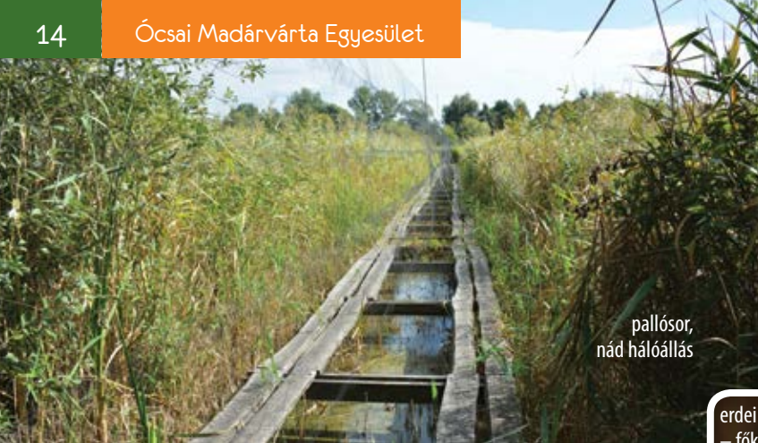
pallósor, nád hálóállás