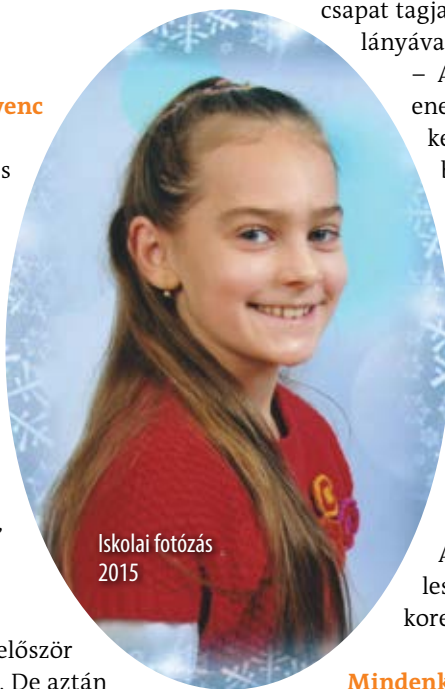
Iskolai fotózás 2015

Igen, a 2013-as első Európa Bajnokságra, ahol arany érmet szereztünk. Egy majmos táncal nyertünk formációban.