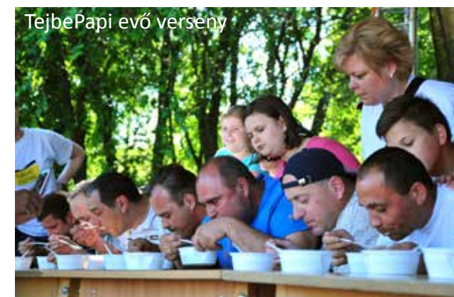
TejbePapi evő verseny

Ha már Tejbegríz Fesztivál, azt gondolom, nem árulok el nagy titkot, hogy a főszerep természetesen a tejbegrízé volt. A Tejbegríz bár egész nap nyitva állt, ahol mindenki degeszre ehette magát a TS Gastro Kft. jóvoltából. Ezenkívül a gyerekek végig mehettek a tejtűt öt állomásán is a pecsétért, ahol boci puzzle, doboz döntőgető, tejvesztő, portéka szelektáló és daraturkáló várta őket, és ha összegyűjtötték mind az öt pecsétet garantált nyereményben részesültek. Mindemelett egy tíz kérdésből álló Tejbe-kvíz is várt mindenkit, melynek három nyertese ajándékban részesült. Ez nem más volt, mint egy kimondottan erre az al-