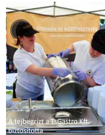
A tejbegrízt a TsGastro Kft. biztosította

Az idei évben egy rendhagyó gyermeknapot szerveztünk Ócsán, hiszen megrendezésre került az első Tejbegríz Fesztivál, mely nagy várakozással töltött el bennünket, dolgozókat, de úgy gondolom, hogy a gyerekeket és a felnőtteket is egyaránt.