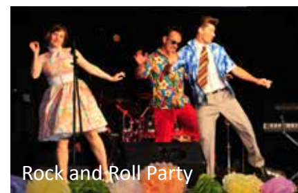
Rock and Roll Party