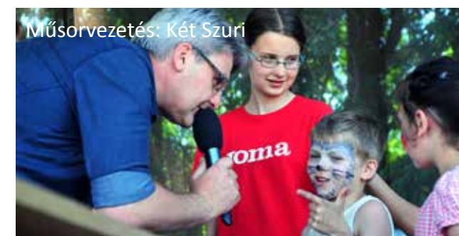
Műsorvezetés: Két Szuri