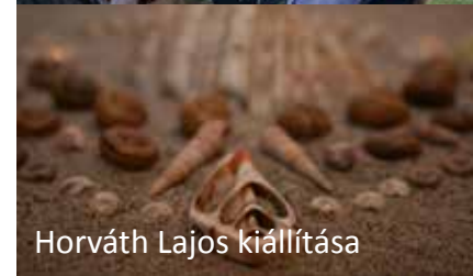
Horváth Lajos kiállítása