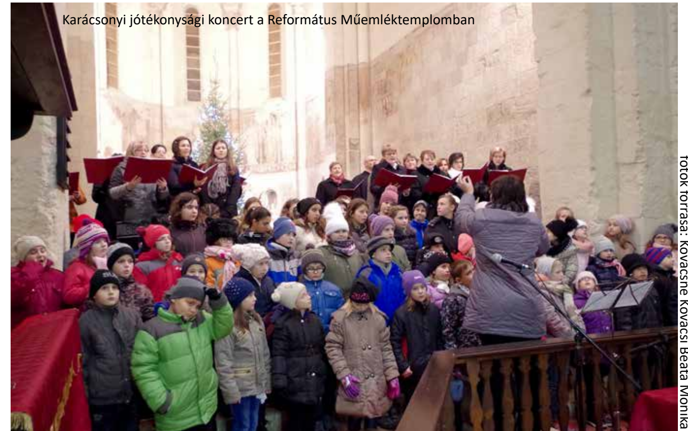
Karácsonyi jótékonysági koncert a Református Műemléktemplomban

Immáron 9. éve, hogy minden évben iskolánk diákjai és pedagógusai Karácsonyi Jótékonysági Koncertet szerveznek városunk egyedülálló református műemléktemplomában. A szülői munkaközösség és a tanárok pedig közös összefogással Szülő-Nevelő Bálon kéri a város lakosságát, a szülőket: volt, jelenlegi és leendő szülőket közös gondolkodásra, közös szórakozással összekötve.