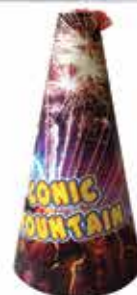
Vulkán tűzijáték 200 g F2 2400 Ft/db

Ingyenes kiszállítás 5000Ft feletti rendelés esetén Ócsa és Alsópakony egész területére.