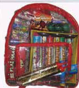
Pyro hátizsák 3100 Ft/db

Az újságban szereplő akció 2020.12.01-től 2020.12.31-ig érvényes.