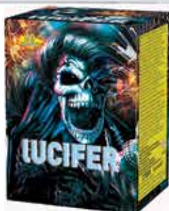
Lucifer 20 lövéses tűzijáték 150 g F2 Kaliber: 20 3200 Ft/db