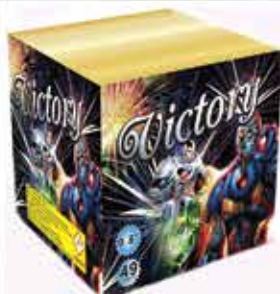
Victory 49 lövéses tűzijáték 368,5 g F2 Kaliber: 20 8800 Ft/db