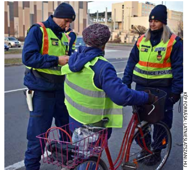
KÉP FORRÁSA: LATINIESLATSZANI.HU

Biztosítottuk a „Radics József emlékfutást”, 3 lovas illetve 2 gyalogos polgárőrrel, egy esküvői menetnek segítettünk átkelni a kereszteződésen, továbbá a Bajcsy Zsilinszky és a Széchényi utca kereszteződésében egy balesetnél forgalmat irányítottunk segítve a rendőrség munkáját.