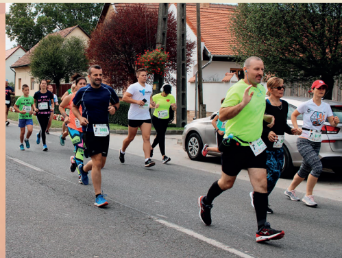
7. UFÓ ÓCSA FUTÁS 14. OLDAL