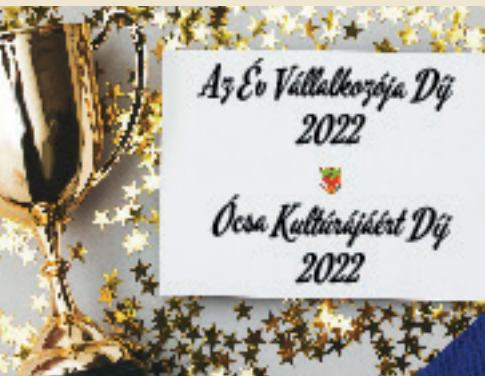
KITÜNTETŐ DÍJAK ADOMÁNYOZÁSA 4. OLDAL

ÓCSA VÁROS ÖNKORMÁNYZATÁNAK INGYENES LAPJA