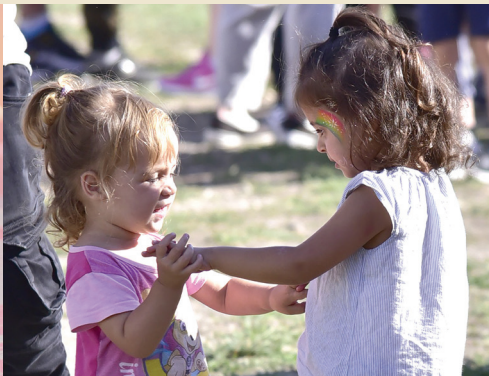
16. VÁROSI VIGASSÁG 6. OLDAL