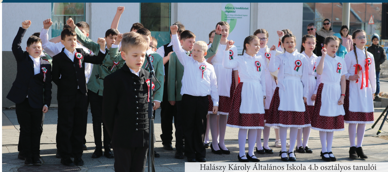
Halászy Károly Általános Iskola 4.b osztályos tanulói