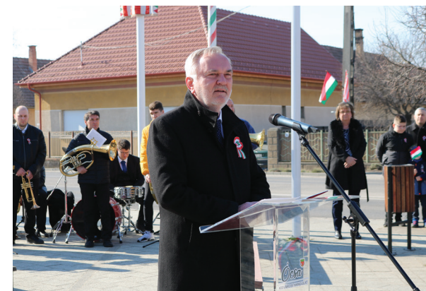
Pánczél Károly országgyűlési képviselő