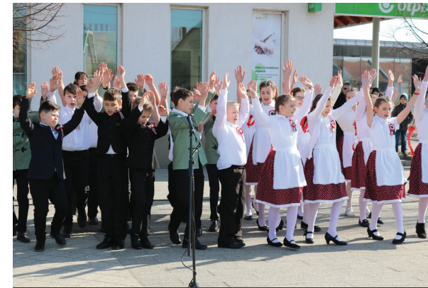
Halászy Károly Általános Iskola 4.b osztályos tanulói