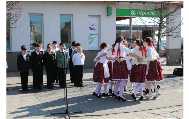
Halászy Károly Általános Iskola 4.b osztályos tanulói