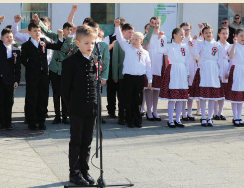
A MI MÁRCIUS 15-I ÜNNEPÜNK

ÓCSA VÁROS ÖNKORMÁNYZATÁNAK INGYENES LAPJA