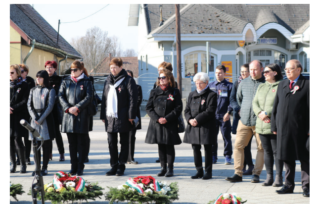
Résztevők - Szabadság tér