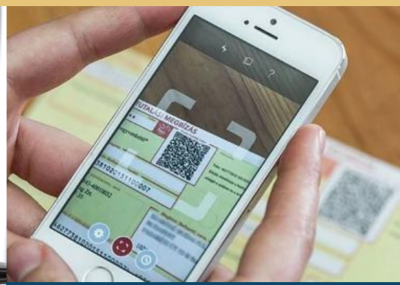
QR-kóddal ellátott csekk beolvasása