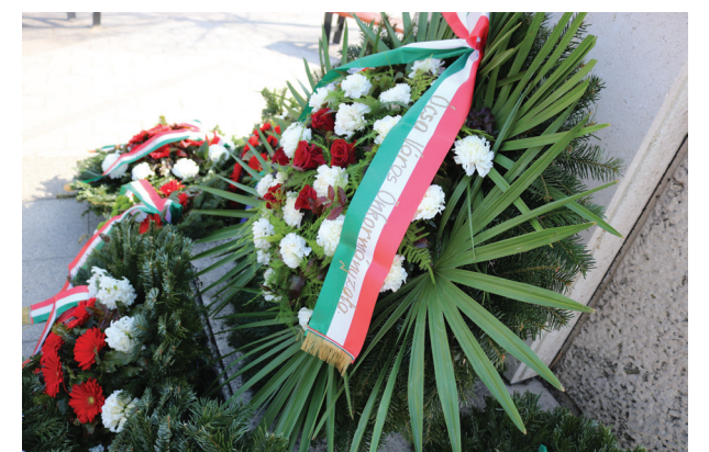
Koszorúk a Turul-emlékműnél