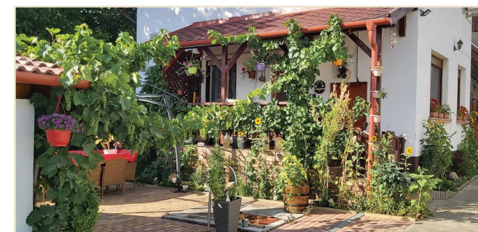
Budainé Kollár Erzsébet