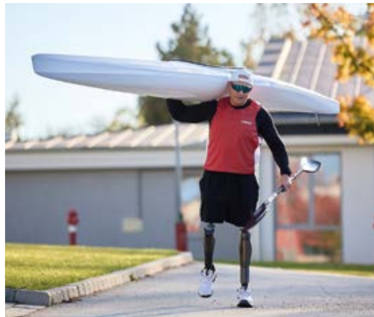
Tibi rengeteget edz, hogy karbantartsa magát

„A baleset után hetekkel később már regenerálódtam annyira, hogy próbálgattam járni. Akkoriban a műlábak szép számmal cserélődtek nálam, mert amint felálltam, megállíthatatlan voltam, és gyorsan elnyűtem a lábaim” – beszélt tovább Tibi. Elmondta, hogy abban az időben a művégtagok nem voltak olyan kényelmesek, áramvonalasak, mint ma, ő mégis gyorsan megtanult