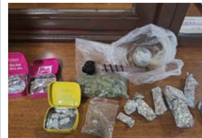
Több zacskónyi marihuána és kristály volt a gyanúsítottnál