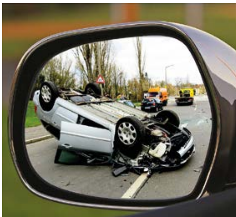
A fotó csak illusztráció

Ócsa város vezetősége ezért mostantól több figyelmet szeretne szentelni a közlekedőkre. Az elkövetkezendő időben rövidtávon a tervek között szerepel több sebességkorlátozó tábla kihelyezése, iskoláknál parkoló bővítése, további mérési pontok kialakítása, sőt, egy mobil rendszámfelismerő általános igazoltató eszköz beszerzése is napirenden van. Valamint hosszabb távon az is, hogy kiépített kamerarendszer figyelje az utakat, az ócsai utcák biztonságosabbá tételéhez.