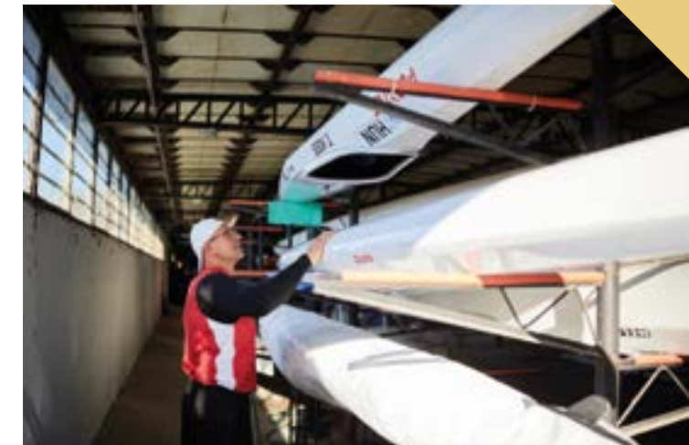
A kajak előtt ülőróplabdázott, a sport a szenvedélye