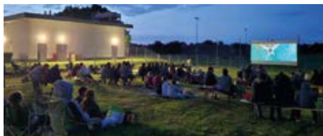
Egyik első rendezvényük, a kertmozi is sokakat érdekelt